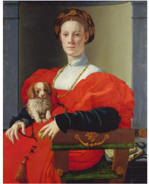
Agnolo Bronzino Portrait de dame en rouge 1532-35, huile sur bois, 89,7x70,5 cm Francfort, Stadel Museum