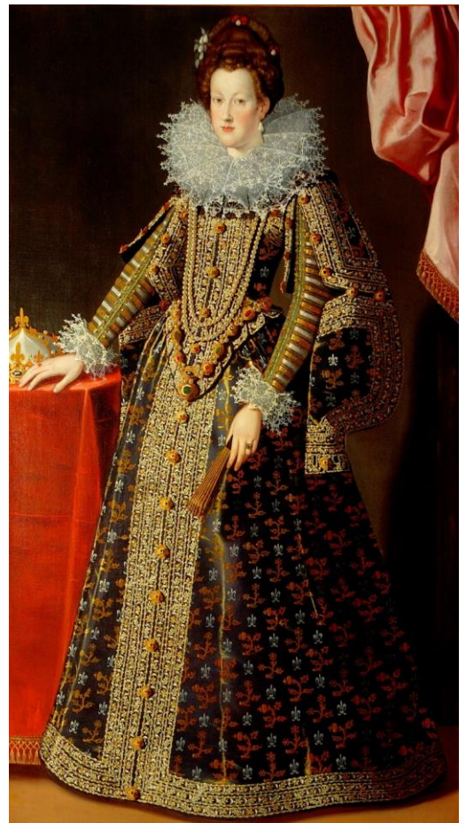
Santi di Tito et atelier Portrait de Marie de Médicis 1600 env., huile sur toile, 194 x 111 cm Florence, Galleria Palatina