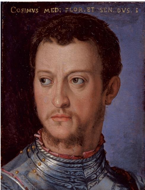
Agnolo Bronzino et atelier Portrait de Côme Ier de Médicis en armes Avant 1560, huile sur étain, 16 x 12 cm Florence, Galerie des Offices